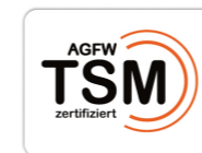
TSM – zertifiziert in den Sparten Strom, Erdgas, Trinkwasser und Fernwärme