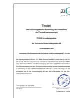
Testat energetische Bewertung der Fernwärme, Ingenieurberatung ZICON