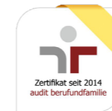
Zertifikat audit berufundfamilie

TWL entwickelt sich stetig weiter. Auch 2025 zeigen Auszeichnungen und Zertifikate, dass wir auf dem richtigen Weg sind.